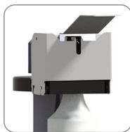
Bügelspender mit Diebstahlsicherung