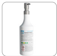
Mittelflasche mit Edelstahlpumpkopf

Der montierte A4 Klapprahmen wird mit dem abgebildeten Poster geliefert, das durch eigene Hinweisschilder ersetzt werden kann.