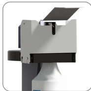
Bügelspender mit Diebstahlsicherung