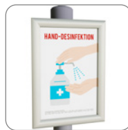
DIN A4 Klapprahmen