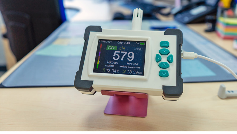
Zeit zum Lüften