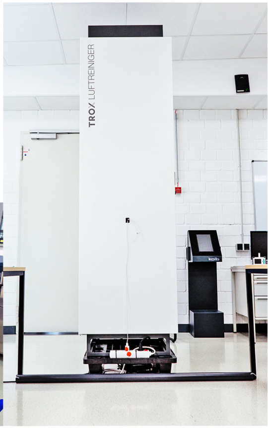
... wenn die Luft rein ist