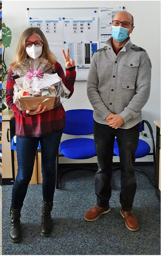
... so geht Jubiläum heute.