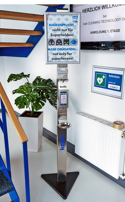
Eigentlich arbeiten hier NUR Superhelden

Unser Service ist natürlich auch jetzt während der normalen Bürozeiten wie gewohnt unter der bekannten Rufnummer 02154-9479-44 und / oder Email service@kolb-ct.com erreichbar. Für Serviceanforderungen, die nicht unbedingt einen Besuch erfordern, leisten wir Telefon-, Online- und Videochat-Support.