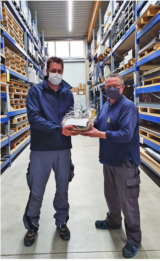
So oder ...