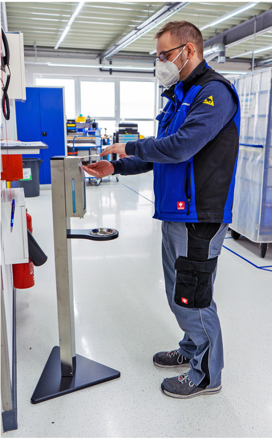
Desinfektionsmittel eigene Herstellung