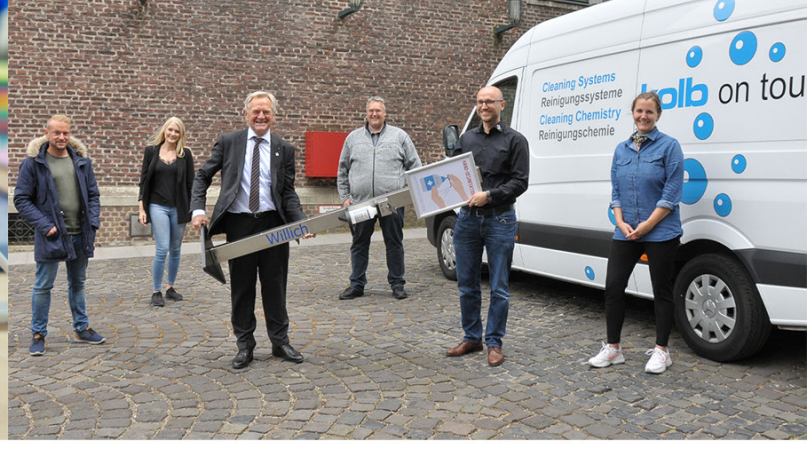
kolb for Community - Spende von Desinfektionsständern an die Stadt Willich