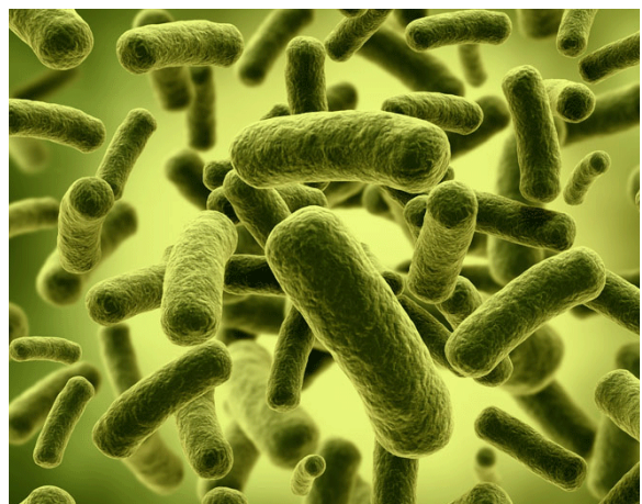
Bakterieneintrag in Spülwasser durch Reinigungsgüter